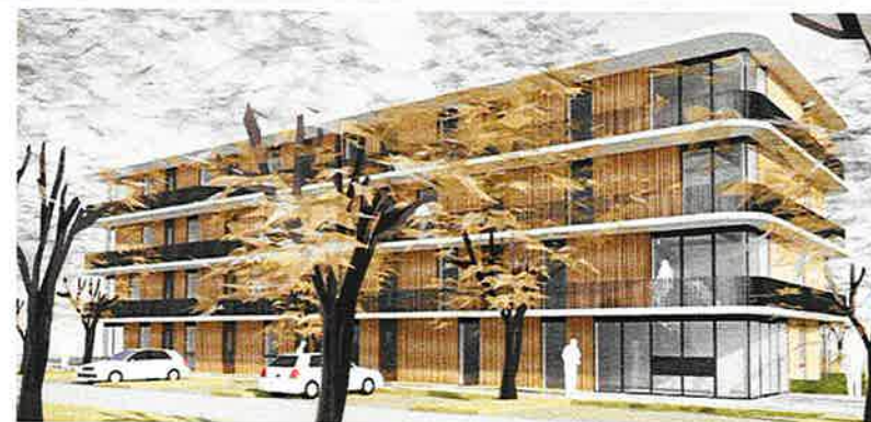
Nieuwbouw combinatie van wonen met zorg (Joost van Vondellaan)