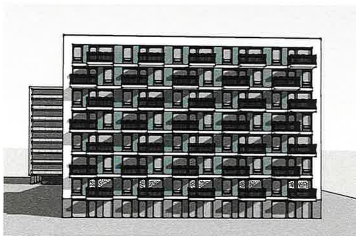
Nieuwbouw combinatie middenhuur – sociale huur (Nijenheim)