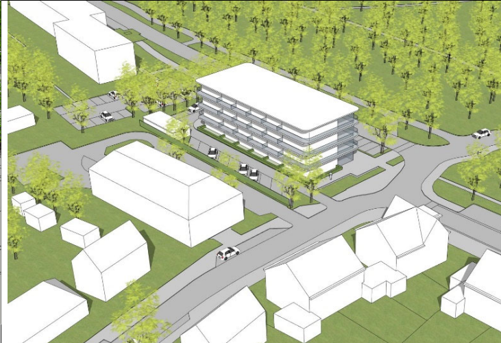
Voorlopig ontwerp d.d. 5-11-21 4 lagen woningen